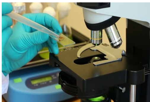
PATOHISTOLOŠKI PREGLED KAO DIJAGNOSTIČKA METODA