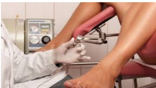
GINEKOLOŠKI PREGLED POD SPEKULIMA